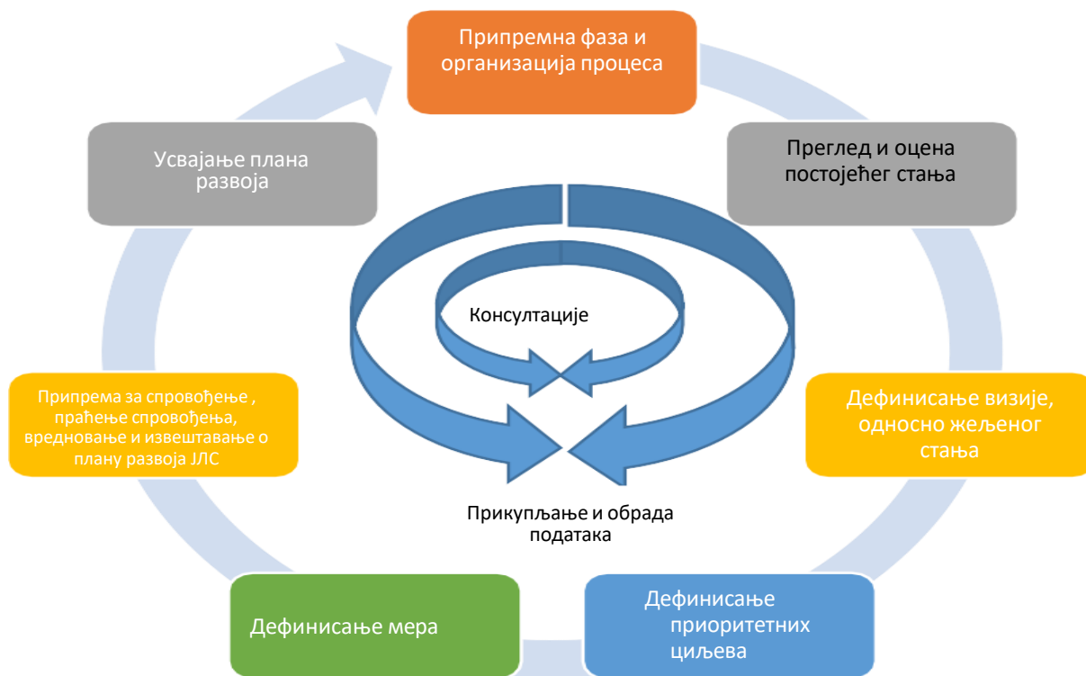
Слика 1. Фазе израде Плана развоја