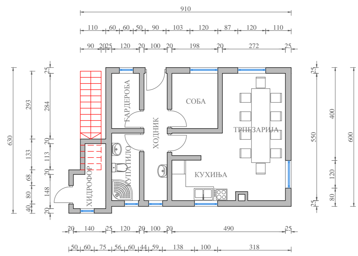
ОСНОВА УПРАВНОГ ОБЈЕКТА P = 1:100