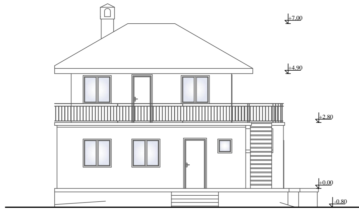
СЕВЕРНА ФАСАДА УПРАВНОГ ОБЈЕКТА P = 1:100