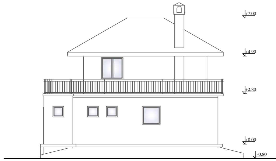
ЛУЖНА ФАСАДА УПРАВНОГ ОБЈЕКТА P = 1:100