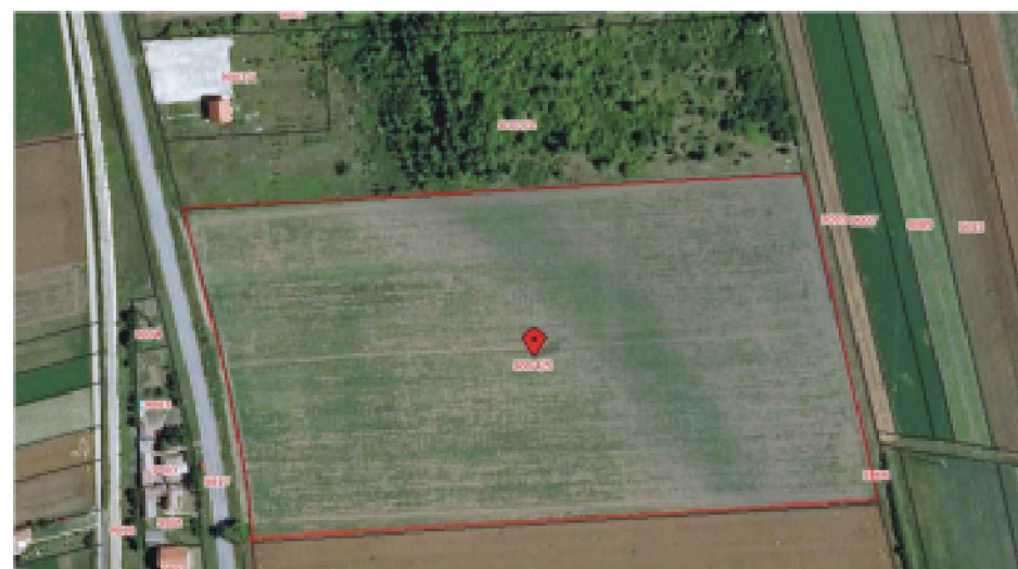
УЖА СИТУАЦИЈА ЛОКАЦИЈЕ