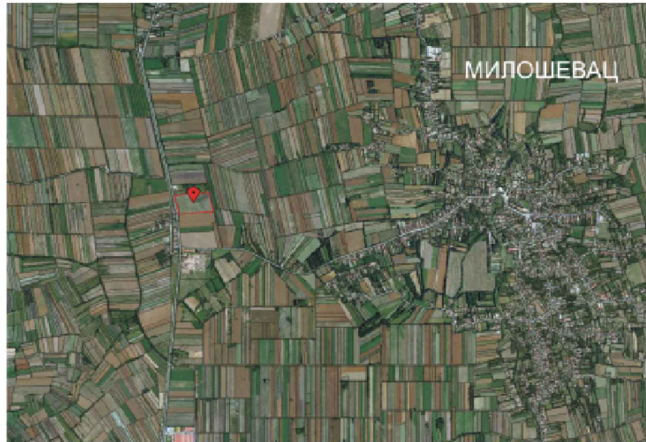
ШИРА СИТУАЦИЈА ПРЕДМЕТНЕ ЛОКАЦИЈЕ