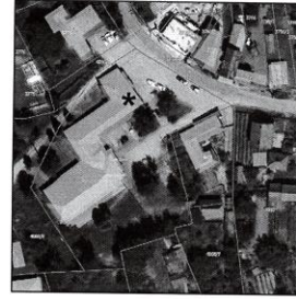
- položaj u okviru objekta / parcele

Lokal pored Doma kulture u Starom Selu, ul. Bulevar Oslobođenja 17 / Sraro Selo / k.p.br. 4008/4